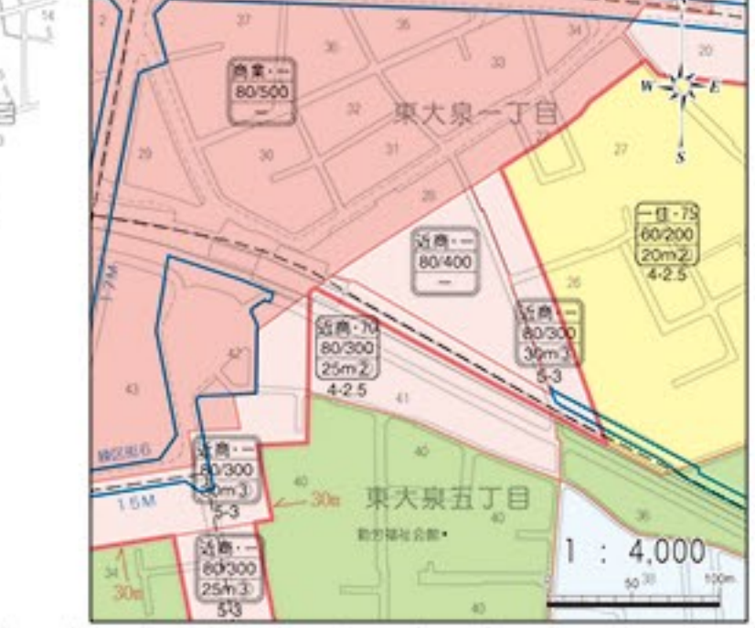
練馬駅北口周辺拡大図