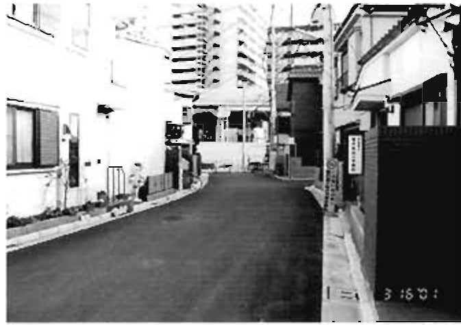
生活道路 13 路線 (幅員 6m)