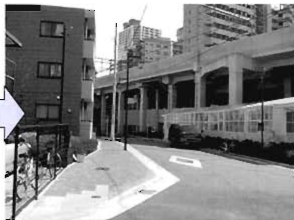
アクセス道路 (幅員 8m) 整備後