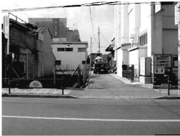
生活幹線道路 12 路線 (幅員 9m・整備中)