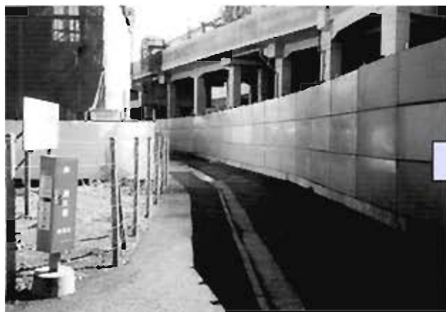
アクセス道路 (幅員 8m) 整備前