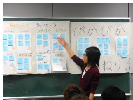
発表の様子（第1グループ）