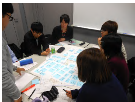
ワークショップの様子（第1グループ）