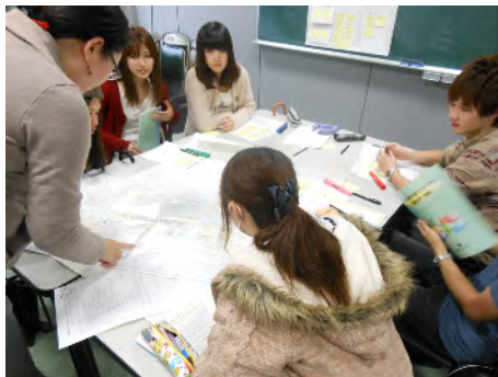
ワークショップの様子（第3グループ）