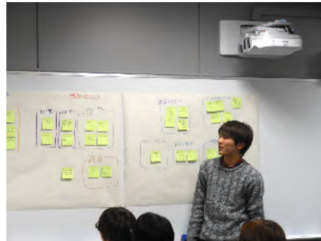
発表の様子（第2グループ）