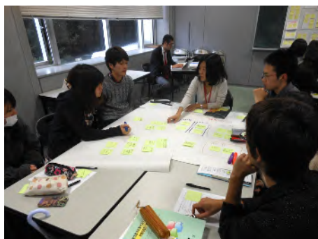
ワークショップの様子（第2グループ）