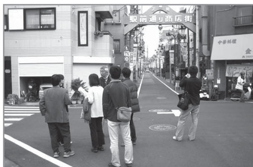
【まちあるきの様子(昨年度)】

今後は、提言書を練馬区に提出するとともに、東京都や鉄道事業者などの関係機関にも働きかけていきます。