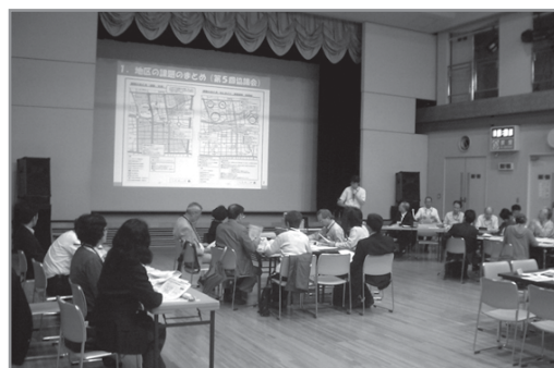
【協議会での検討の様子】