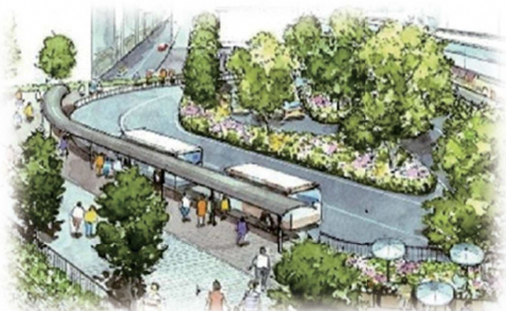
※イラストは現段階でのイメージです

説明会（表面参照）では、連続立体交差化計画とあわせて、武蔵関駅駅前広場や側道の都市計画案を示しました。