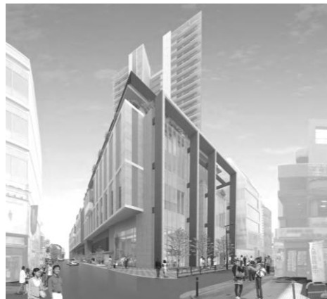
▲区道 22-135 号線と 区道 22-150 号線交差点より