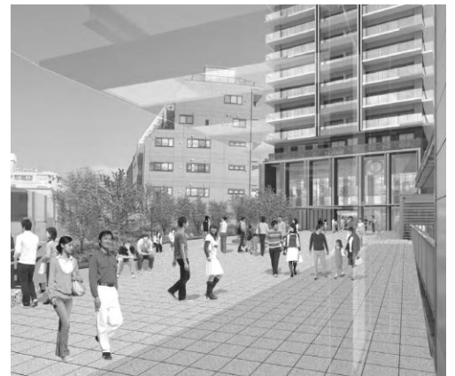
▲ペDESTリアンデッキより