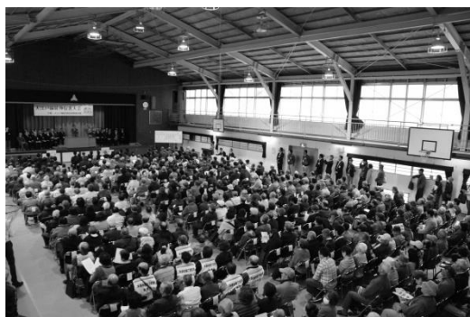
【大江戸線延伸促進大会の様子】