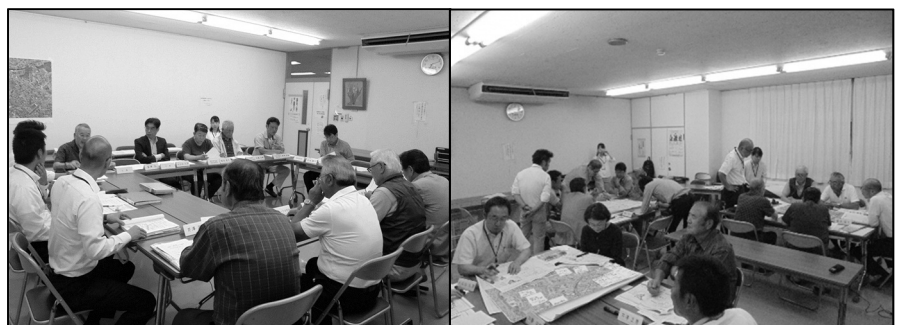
▲まちづくり協議会の様子