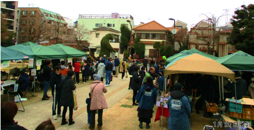
◆出店された地域の方々（パンフレットより抜粋）

日時：令和6年1月20日（土）のみ／21日（日）については悪天候のため出店中止 参加人数：約 3000 人 ※緑地に設置されているカウンター(2箇所)より類推した数値