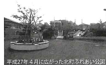
平成27年4月に広がった北町ふれあい公園