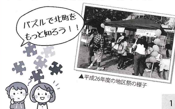
▲平成26年度の地区祭の様子

11月1日(日)に北町小学校で開催される第八地区祭に、東部地域まちづくり課も参加します。今年の「まちづくりコーナー」ではまちづくりゲーム「北町ジグソーパズル」を実施します。「まちづくりコーナー」へのご来場をお待ちしております。