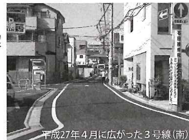
平成27年4月に広がった3号線(南)