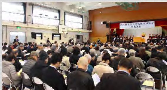
結成大会会場の様子