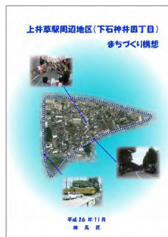
出そろった3地区のまちづくり構想（表紙）

※まちづくり構想は区役所に常備してあるほか、区のホームページにも掲載されていますので是非ご覧ください。