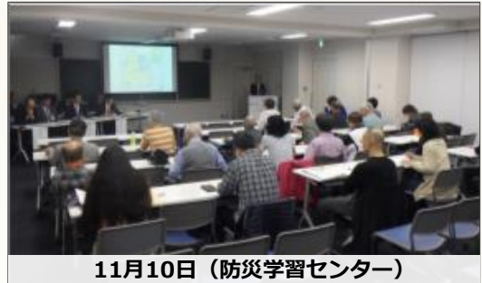
11月10日（防災学習センター）