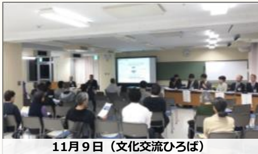
11月9日（文化交流ひろば）

前号でもお知らせしたとおり、平成30年11月9日(金)、10日(土)に「光が丘地区地区計画変更素案説明会」を開催しました。多くの皆さまにご出席いただき、誠にありがとうございました。