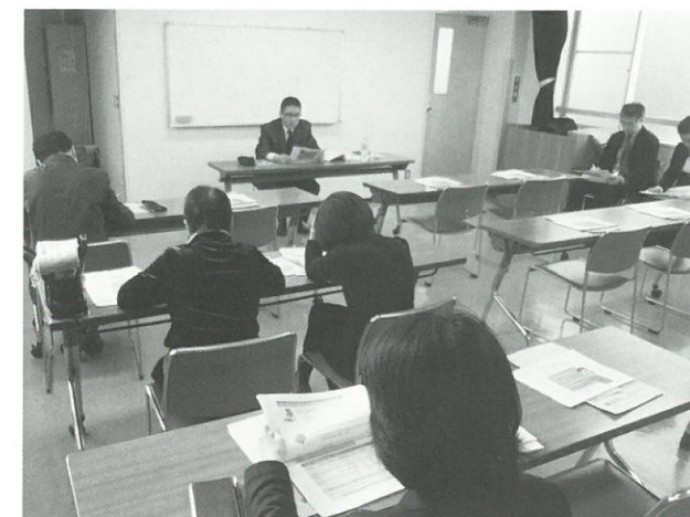
すまいづくり講座の様子 ▲