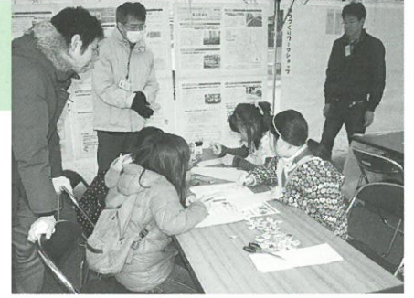
まちづくり標語づくりの様子 ▲

昨年3月の小竹町会主催の桜まつりで催した、「まちづくり標語コンテスト」には、多数の標語をお寄せいただきありがとうございました。参加者による投票をもとに選出した優秀賞の8作品をご紹介します。