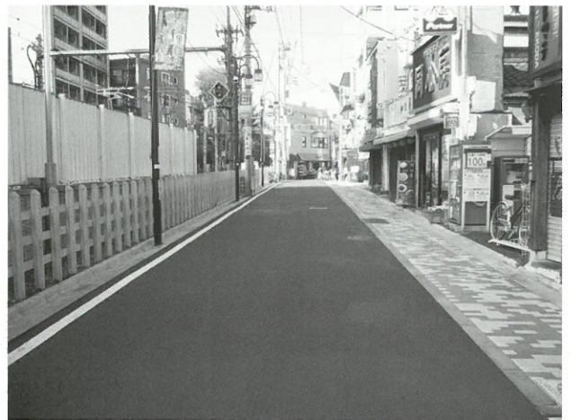
主要生活道路7号線の整備の様子 ▲

平成24年度は主要生活道路7号線西区間（ゆうゆうロード入口の踏切部から錦華学院入口部まで）の道路整備を行いました。この区間は西武鉄道の協力で、以前は鉄道の追い越し待機線のあった鉄道用地を活用し、6m幅の道路に拡幅整備を行うことができました。舗装は主に自動車が通行する部分（幅4.5m）をアスファルト舗装とし、商店側は主に歩行者が通行する部分として幅1.5mのインターロッキングブロックによるカラー舗装を行っています。