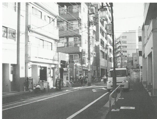
生活幹線道路A路線5工区の様子 ▲

今後も引き続き整備等のまちづくりを進めることが必要であることから、事業期間を平成27年度まで四カ年延伸しました。整備計画の実現に向けて地区内の皆様のご協力を今後もよろしくお願いいたします。