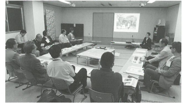
地区計画検討部会の様子 ▲

今後は、「まちづくり計画」の検討を行っていきませんが、内容は検討報告会やえこだよりの紙面等で皆さんにもご紹介していきます。