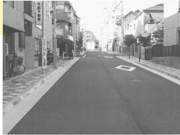
昨年度整備した生活幹線道路A路線3工区

平成23年度は、生活幹線道路A路線3工区南側区間（どれみふぁ緑地から主要生活道路3号線との交差点手前まで）の道路整備を行いました。道路の形状は、平成21年度に整備を実施した北側の区間と同様に、6m幅の車道の両側に1.5m幅の歩道を設置した幅員9mの道路になりました。