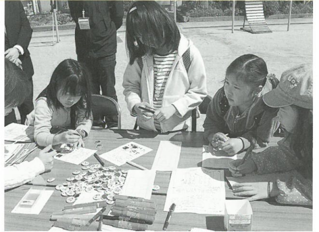
まちづくり標語づくりの様子 ▲

まちづくりに関するキーワードをヒントに、78の標語が寄せられ、参加された皆さんのシール投票によって優秀賞を9作品選び、閉会式で表彰をさせていただきました。