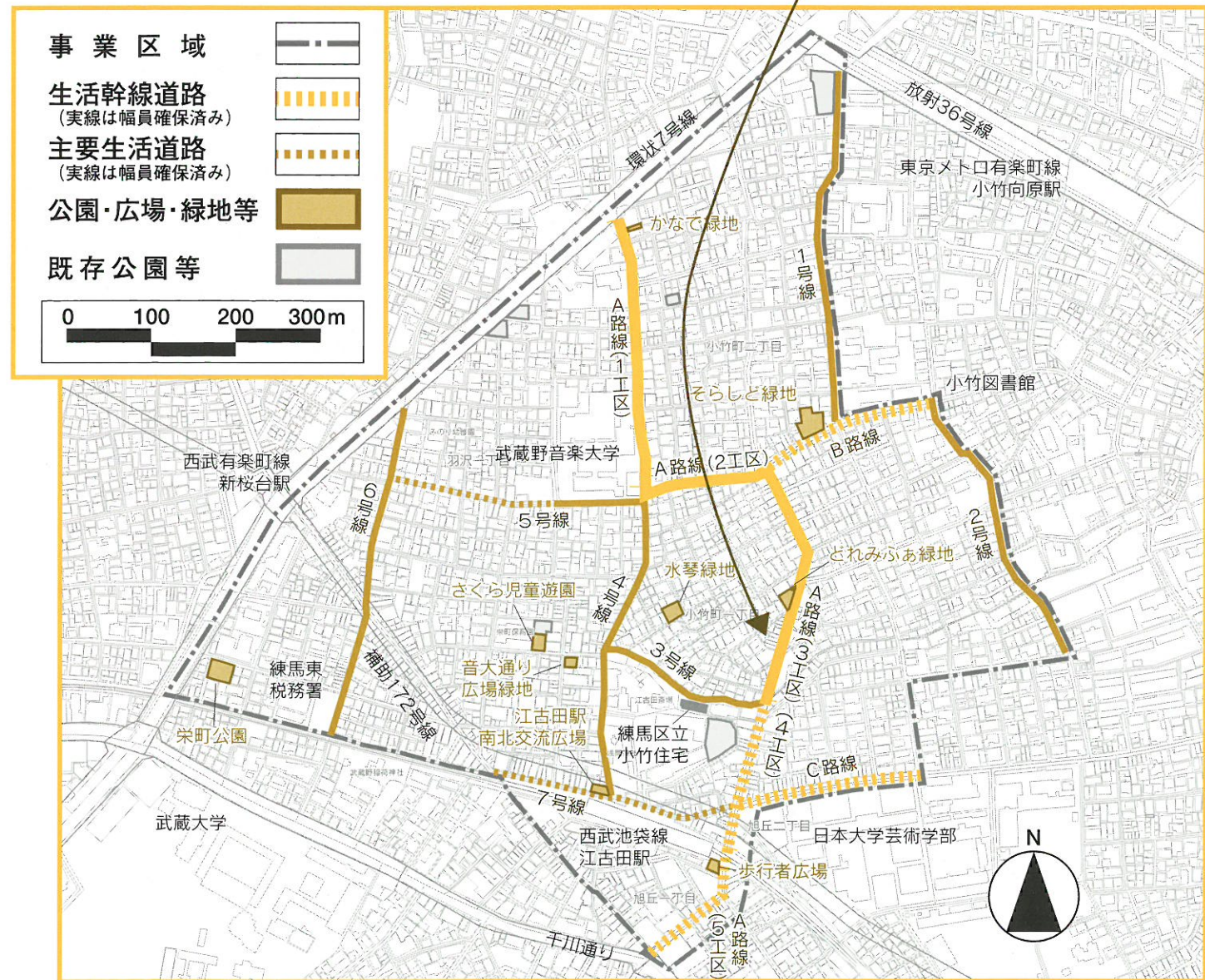
江古田北部地区密集事業整備計画図 ▲

今後の道路整備については、生活幹線道路A路線4工区と5工区、生活幹線道路B路線、生活幹線道路C路線、主要生活道路7号線において用地買収を進めており、これらの整備計画路線についても事業期間である平成27年度までの完成を目標に道路整備を行っていく予定です。