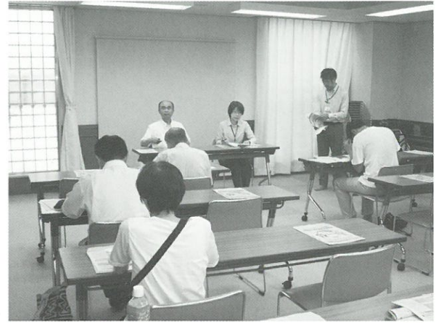
すまいづくり講座の様子▲

「すまい・建替え相談会」では、建物の耐震改修について具体的なご相談がありました。