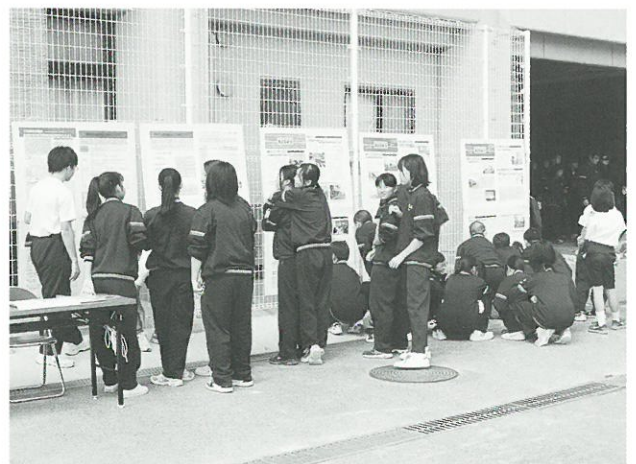
密集事業のパネル展示▲

今後も町会の防災訓練等の場で、防災とまちづくりを気軽に考えていただくコーナーを設置し、密集事業のPRをさせていただきます。