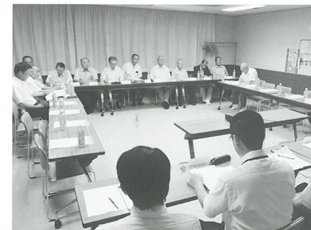
推進協議委員会の様子▲

今年度、事業期間の最終年度を迎える密集事業の今後の展開については、事業期間を平成27年度まで延伸する予定であることを報告し、事業終了後もまちづくりを継続できるようにするため、地区計画の検討を提案いたしました。検討は、町会・商店会の皆様とともにすすめていきます。