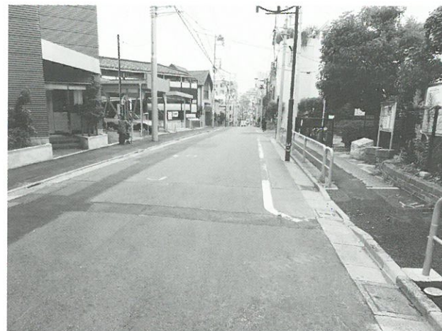
生活幹線道路A路線3工区▲

道路の形状は、既に整備を実施した北側の区間と同様に、6m幅の車道の両側に1.5m幅の歩道を設置する計画です。