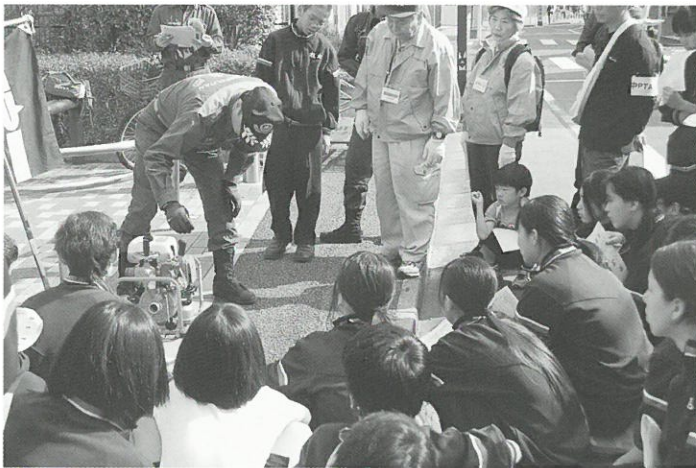
D級ポンプの操作訓練の様子▲

小竹町の一時避難場所のひとつであるそらしど緑地において、防災資器材庫に備えられている道具の説明やD級ポンプの操作訓練と合わせて、密集事業で整備した公園であること、防災設備（非常用トイレ、かまどスツール、ソーラー照明）が設置されていることをご紹介します。