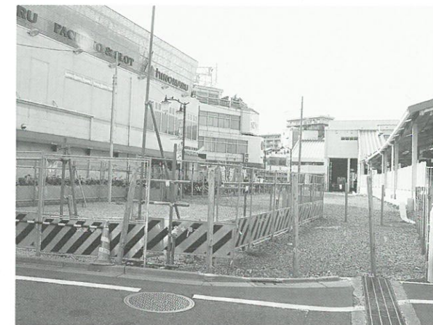
東側踏切から南口広場を見る▲

工事中は、通行等にご迷惑をお掛けしますが、ご理解とご協力をよろしくお願いいたします。