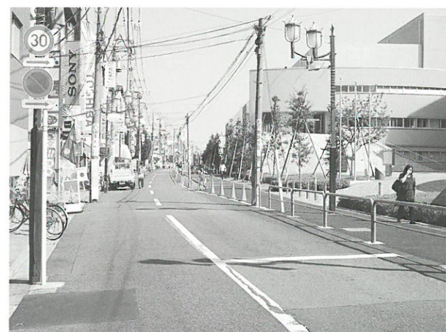
生活幹線道路C路線▲

日本大学芸術学部北側の生活幹線道路C路線では日本大学側の電柱移設工事が完了後、歩道の舗装工事をを行います。