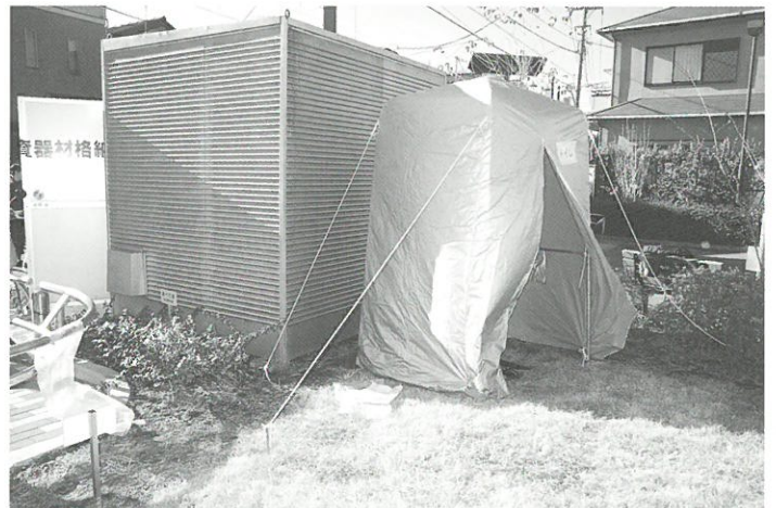
防災資器材庫の裏に設置した非常用トイレ▲

小竹町一丁目の避難拠点になっている旭丘中学校では、ろ過器や発電機などの資器材の操作訓練、煙体験訓練、初期消火訓練、三角巾による止血などの応急救護訓練が行われ、中学生と町会の皆さんが熱心に参加されました。訓練会場では密集事業をご紹介しますパネルを展示し、事業の目的や進捗状況をご紹介しますことができました。