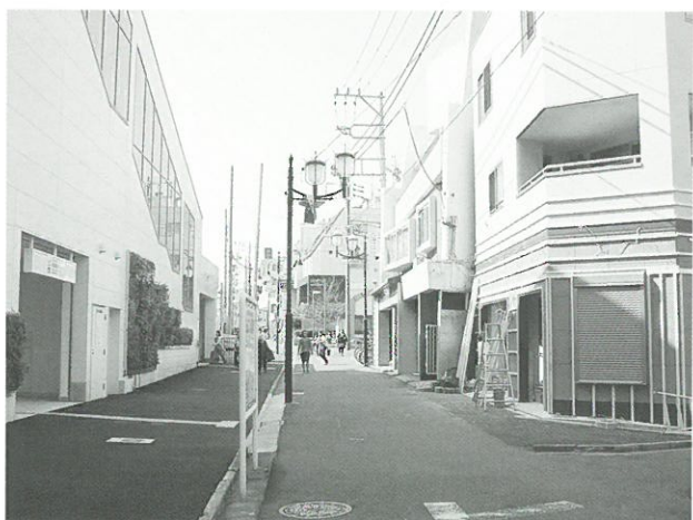
用地買収にご協力いただいています▲

今後も、沿道の皆様にご協力いただけるよう事業の主旨をしっかりとご説明し、本整備の実施につなげていきたいと思っております。