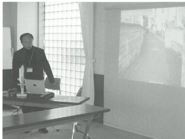
すまいづくり講座の様子▲

「すまいづくり講座」では、「すまいとまちの防犯対策」と題して、東京都セキュリティ促進協力会の防犯アドバイザーの方にお話しをいただきました。まちの治安を考えるには地域の方で事前に危ない場所や心配な場所（路地の死角など）を確認することが大事という説明がありました。