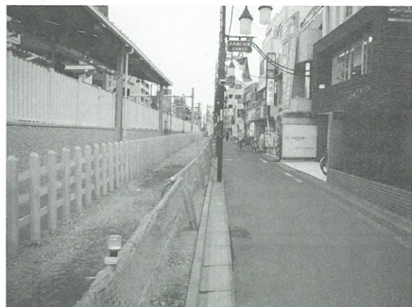
既存道路から駅側の柵までの道路整備を行います▶

現在は駅側に柵が設置され、整備後の幅員をイメージしていただける状況となっています。