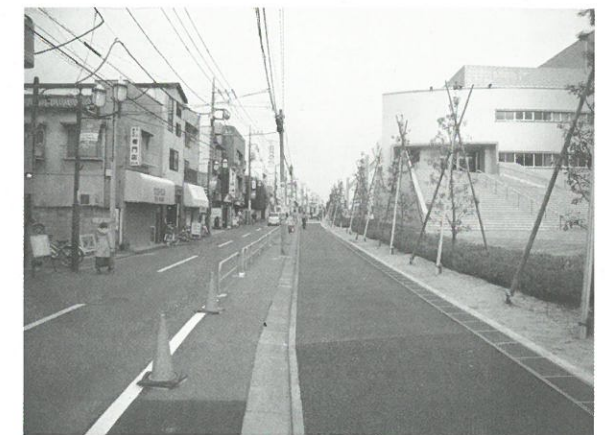
アスファルト舗装部までを整備します▲

日本大学芸術学部にご協力をいただくことで得られたスペースを活用し、大学側に歩道を設置します。整備区間は大学の敷地の東端までとなります。