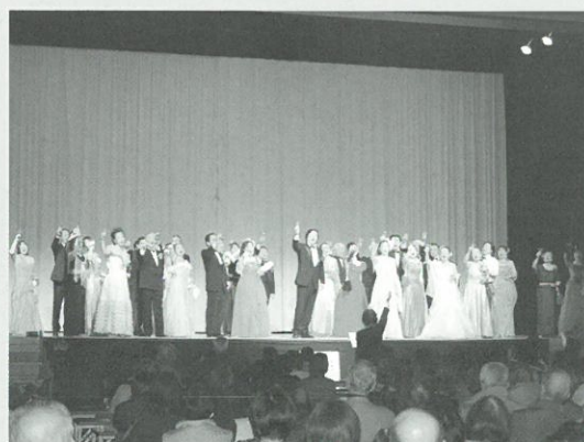
江古田まつりでの混声合唱▲