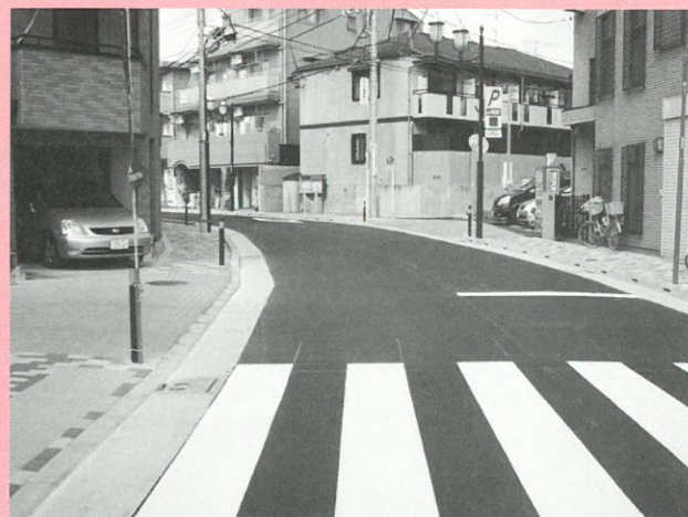
生活幹線道路A路線（小竹通り）の道路拡幅整備工事▲

沿道の皆様のご協力により用地買収や道路整備を進めており、今年度は、生活幹線道路A路線（小竹通り）の一部区間で、車道と歩道の整備が完了しました。