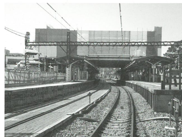
江古田駅改築工事の様子▲

練馬区は、駅舎改築工事に合わせた駅周辺の整備（南北自由通路、生活幹線道路、主要生活道路、歩行者広場、自転車駐車場など）に取り組んでおり、こちらは平成23年度整備完成予定です。