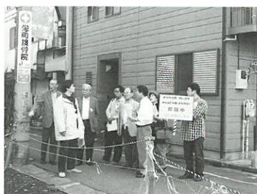
過去のまち歩きの様子▲