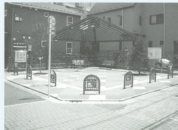
全景(敷地奥に日よけのパーゴラを設置)

栄町38地区の共同建替えに伴い創出された約100㎡の緑地です。音大通りの中央に位置し、買い物広場、お祭り時の利用が期待されます。バイオリンの原材料になるドイツウヒがシンボルツリーとして植えられています。