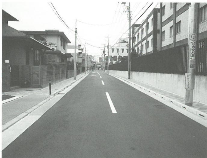
整備を実施した生活幹線道路A路線1工区 （平成18年度）

今後も、引き続き整備を進めるために、事業期間を平成23年度まで延伸し、併せて事業区域の拡大と整備路線の追加、建替え助成要件の一部変更など、密集事業の整備計画の変更を行いました。