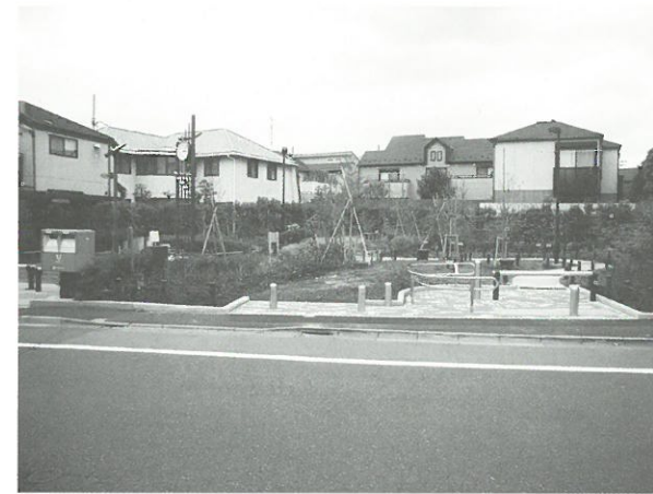
全景(右側が拡張部分)