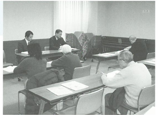
すまいづくり講座の様子

「すまいづくり講座」では、練馬区の「住宅施策ガイド」をもとに、住まいづくりに関する助成制度などをご紹介しました。「住宅施策ガイド」は都市整備部住宅課にて配布しております。関心のある方は窓口までお問い合わせください。