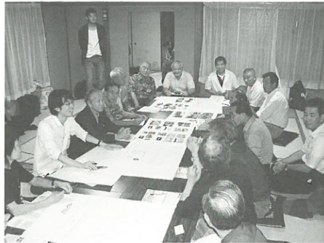
ワークショップの様子

各公園は、計画づくりの段階でワークショップや意見交換会などを行い近隣の皆様のご要望をお聞きし、防災や音楽といった特徴のあるつくりとなっています。皆様ぜひご利用ください。