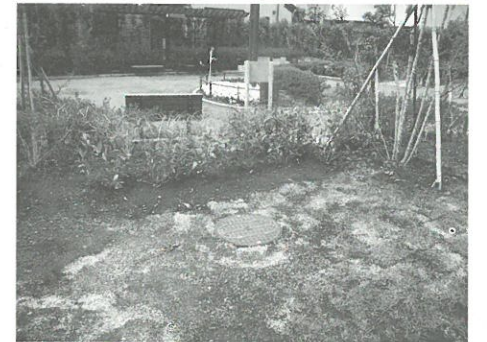
非常用トイレ(内部に簡易トイレを収納)

密集事業で整備したそらしど緑地の東側で、新たに用地を取得し拡張整備を行い、約600㎡の公園となりました。災害時のための非常用トイレやかまどスツールを設置し、散策路も延長できました。