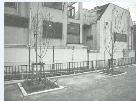
新たに植えられた8種の桜

既存のさくら児童遊園の南側に、新たな用地取得を行い拡張整備を行うことで、約600㎡の公園を整備することができました。新たに災害時のためのかまどベンチや非常トイレが設置され、南北の通り抜けや西隣の栄町保育園の園庭からの直接出入りができるようになりました。