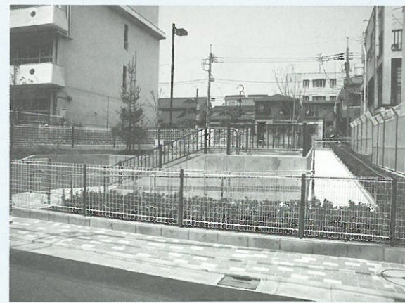
南側道路とは階段・スロープで接続