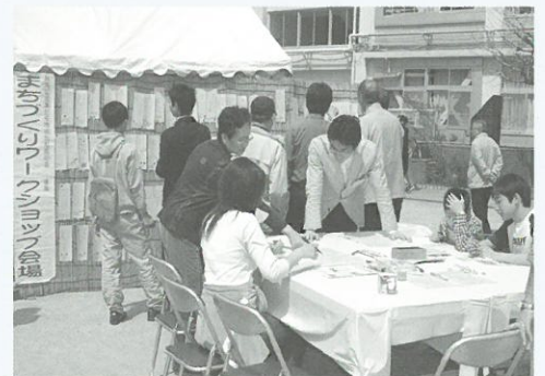
標語づくりの様子