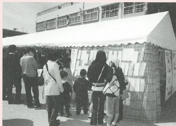
小学生を中心に多くの方にご参加いただきました