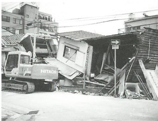
◀ 阪神淡路大震災による木造建物の被害の様子

区が作成した「わが家の耐震診断」による、簡易耐震診断も無料で実施しますので、建物の耐震性を確認してみたい方は、お気軽にご参加ください。