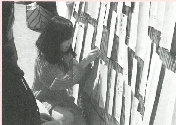
標語をよしずで飾り、シール投票を行いました

まち、小竹町、消防車、自転車、車、公園、広場、みち、空き地、歩く、井戸、商店街、遊歩道、音楽、小竹小、図書館、おとな、こども、学生、お年寄り、大きな木、小鳥、動物、買い物、地震、火事、避難拠点、防災、避難訓練