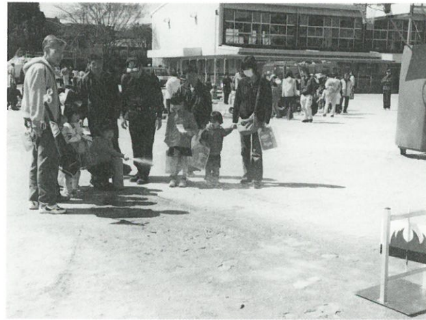
防災訓練の様子（初期消火訓練）

当日は、晴天に恵まれ、素晴らしい陽気の中での「桜まつり」となりました。今年も例年以上に花粉の飛散量が多く、マスクをしている方も目立ちましたが、67の標語を応募していただきました。