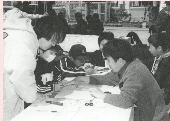
標語づくりの様子

できあがった標語はよしずで飾って、気に入った作品へシール投票も行いました。投票結果をもとに優秀賞を8作品選び、閉会式で表彰しました。