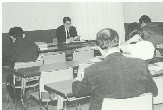
建替え融資説明会の様子

これからも、土地や建物についてお悩みの方々の参考になるような説明会も随時行っていきたくと考えていますので、ぜひご利用ください。