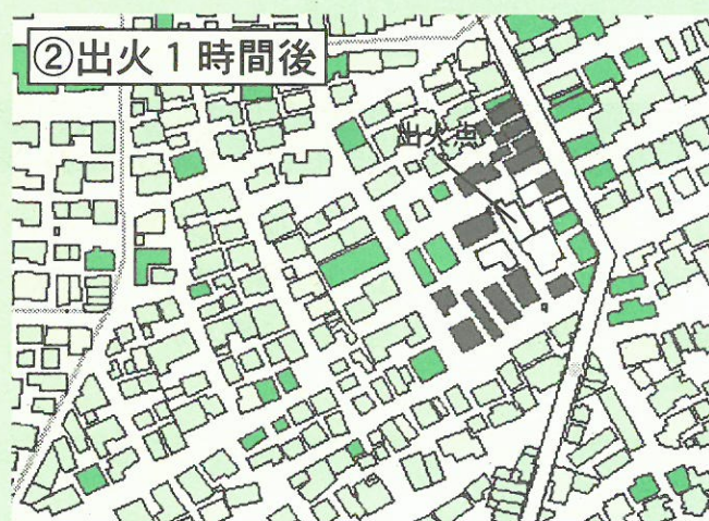
②出火1時間後 出火場所付近の数軒は、すでに焼け落ちてしまいました。