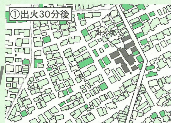
①出火30分後 すぐに隣接の木造建物に燃え移りました。