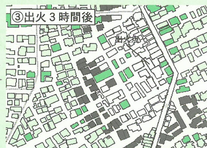
③出火3時間後 一定の道路幅員がある通りの耐火構造の建物の多い場所では延焼が止まっています。