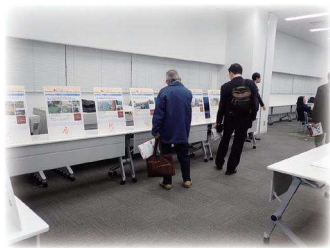
イメージ図 (パネル展示)