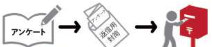
①アンケート(別紙)に記入 ②3つ折りにして封筒に ③ポストに投函(切手は不要)

ご記入いただいたアンケート（別紙）は、 令和7年10月31日（金）まで に同封の返信用封筒（切手不要）にて、ポストにご投函をお願いいたします（消印有効）。