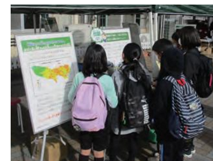
防災クイズコーナー