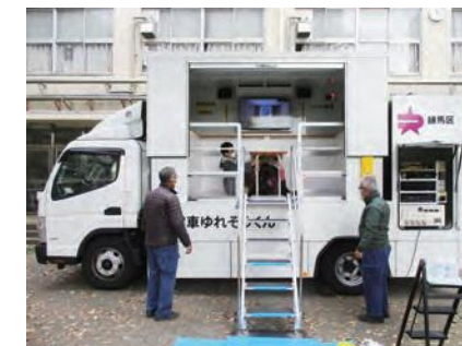
起震車で地震体験