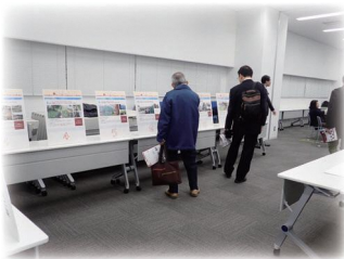
イメージ図 (パネル展示)