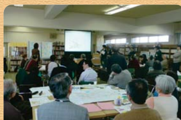
復興計画を検討する

このような地域協働型の震災復興模擬訓練は、いざという時に役立つだけでなく、地域のつながりを深め、まちを見直し、災害に強いまちづくりを進めていくことにも大きく役立ちます。