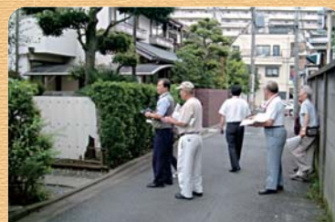
まち点検で被害をイメージ