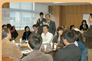
避難拠点から復興に取り組む