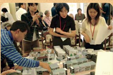
仮設のまちを考える