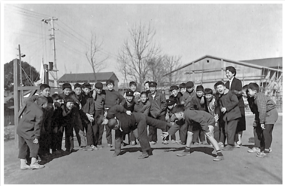
寄贈された写真から「旭丘小学校グラウンドでの相撲（昭和34年）」