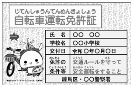
(自転車運転免許証)

新入生を対象に、蛍光反射ランドセルカバーを配布した。また、「自転車の乗り方教室」を実施し、受講した児童に「自転車運転免許証」を発行している。4年度は小学校60校で実施し、5,190人の児童に免許証を発行した。