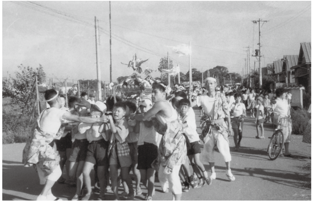
寄贈された写真から「北町八丁目氷川神社の祭礼（昭和 30 年代）」