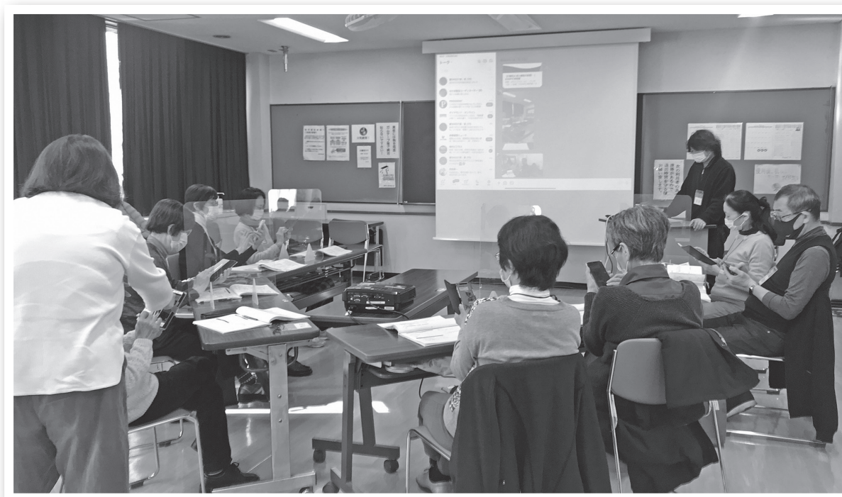
認知症予防・脳活プログラム（SNS編）の様子