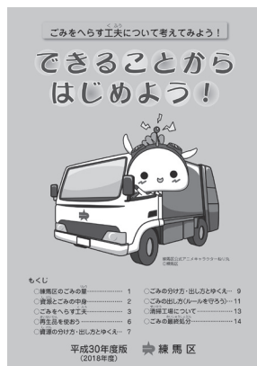
〔「できることからはじめよう!」〕

主に小学校4年生を対象に、模擬ごみの分別体験を通じ、ごみの分別等への関心を持ってもらうほか、環境学習車を使ってごみ収集