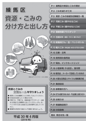
〔練馬区資源・ごみの分け方と出し方〕

区で行っている取組について、普及啓発用パンフレット「練馬区資源・ごみの分け方と出し方」および情報紙「ねりまの環」を作成し、情報を発信している。