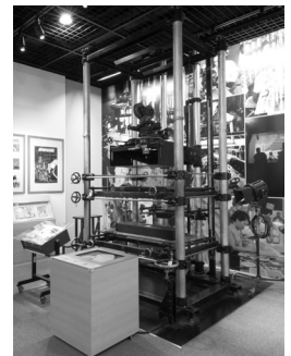
アニメーション撮影台 練馬区 写真①