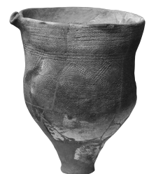
丸山東遺跡出土の片口土器 練馬区 写真②