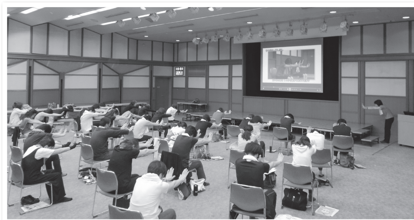
健康寿命を伸ばすことを目的とした区オリジナルの体操「ねりま ゆる×らく体操」の講習風景