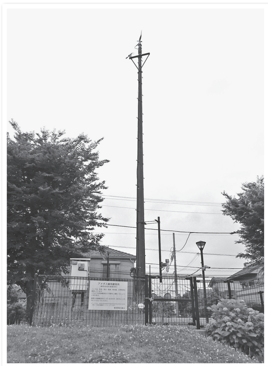
石神井松の風文化公園にある 「アメダス練馬観測所」