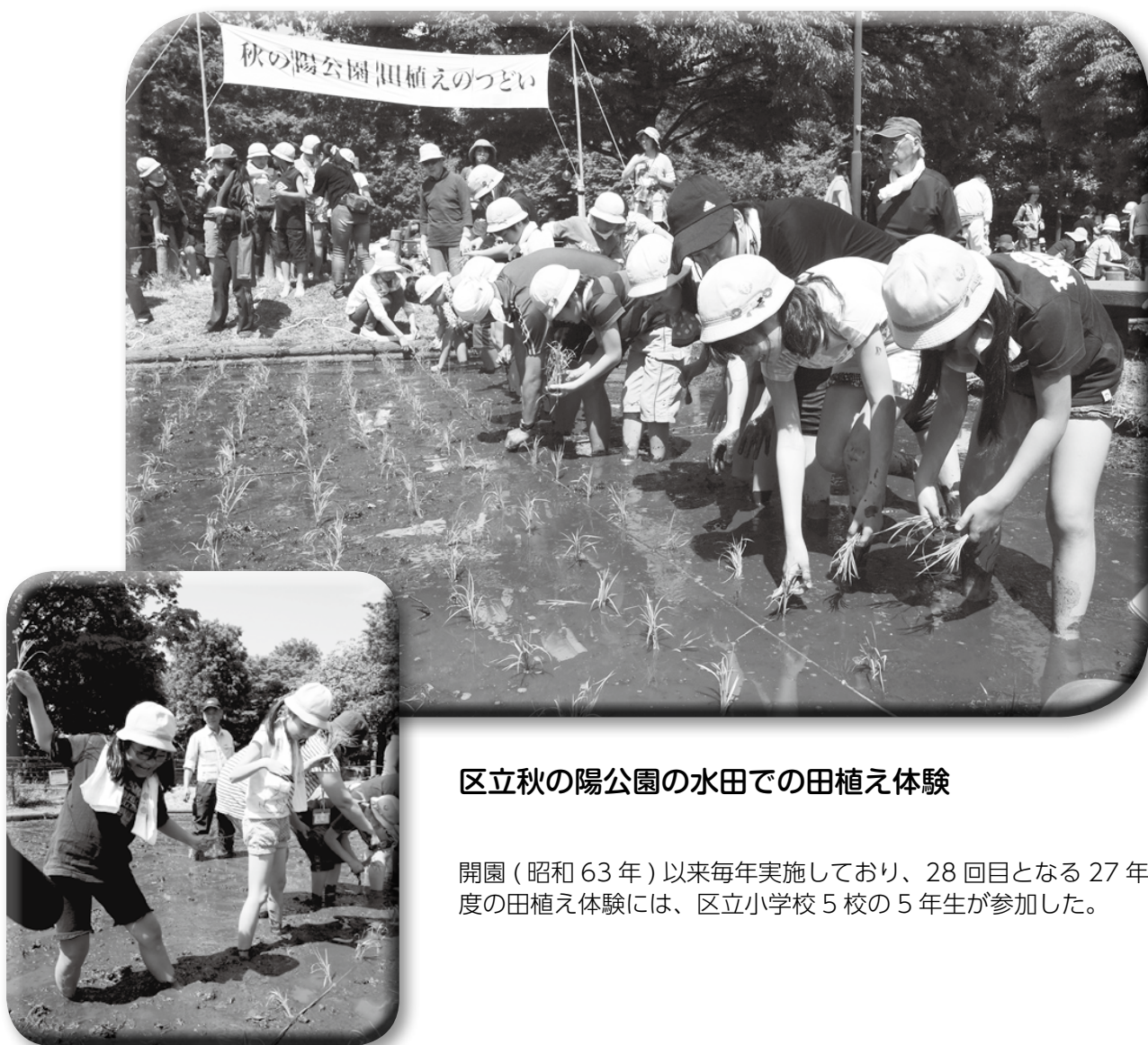
区立秋の陽公園の水田での田植え体験

開園（昭和63年）以来毎年実施しており、28回目となる27年度の田植え体験には、区立小学校5校の5年生が参加した。