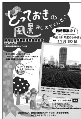
〔地域景観資源登録制度 パンフレット〕