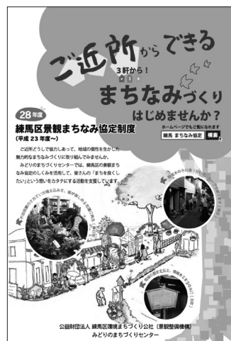
〔景観まちなみ協定制 パンフレット〕