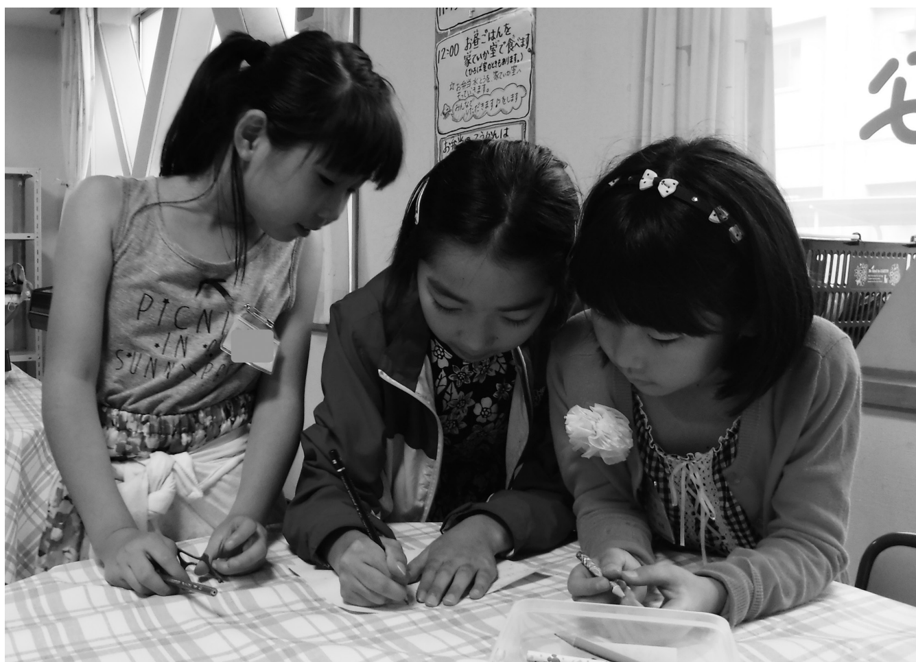
ねりっこひろばで過ごす子どもたち（北町西小ねりっこクラブ）