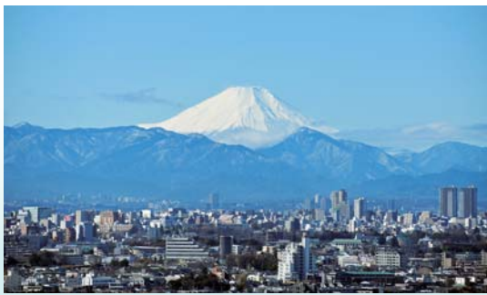
区役所20階展望ロビーからの眺め

区政情報だけでなく、担当者が「まちの話」やイベントなどを取材・体験し、その感想や臨場感あふれる現場の様子を伝えています。