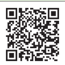
二次元 バーコード