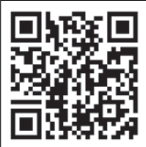
▲申し込みは こちら