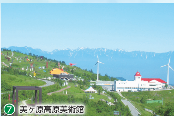
⑦ 美ヶ原高原美術館