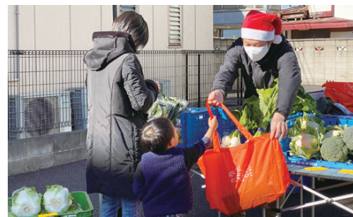
12月のマルシェの様子

練馬産の旬の野菜や加工品などを販売するマルシェ(即売会)を開催します。新鮮でおいしい練馬産農産物と出会うマルシェに出掛けてみませんか。▶区の担当: 農業振興係