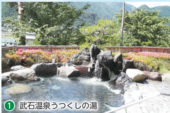
① 武石温泉うつくしの湯