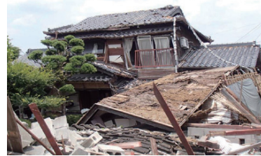
▲熊本地震による被害の様子

東京消防庁によると、平成28年に起きた熊本地震では、けがの原因の3~4割が家具の転倒・落下などによるものでした。ご自宅が安全な場合は、避難所に避難する必要はありません。防火防災診断を受けて、災害時も自宅で生活できるようにしましょう。