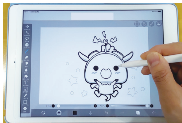
練馬区公式アニメキャラクター「ねり丸」 ©練馬区

デジタルイラストの基本を絵画アプリを使って学びます。 ▶対象:15~39歳の方(中学生を除く) ▶日時:2月6日(土)①午前10時30分~午後0時30分②午後1時30分~3時30分③午後4時30分~6時30分 ▶場所:春日町青少年館 ▶講師:デジタルイラストレーター/佐藤江里 ▶定員:各10名(抽選) ▶持ち物:タッチペン ▶申込:ハガキまたは電子メールで①講座名(①~③の別も)②住所③氏名(ふりがな)④年齢⑤電話番号を、1月27日(必着)までに〒179-0074春日町4-16-9 春日町青少年館 ☎3998-5341 [Eメール] youth1@city.nerima.tokyo.jp