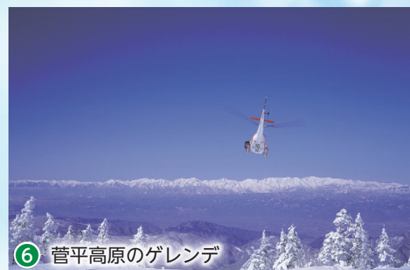
⑥ 菅平高原のゲレンデ