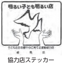
協力店ステッカー

健やか運動協力店は、子どもたちと触れ合う機会の多い商店の皆さまに、子どもたちへの声掛けや、非行防止の働き掛けに協力していただくものです(現在の協力店は1,713店)。11月の子ども・若者育成支援強調月間に合わせて、青少年育成地区委員会の委員が各商店に伺い、健やか運動協力店の説明と新規