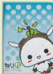
ねり丸クリアファイル

練馬区観光案内所(練馬駅地下1階)などで好評販売中です。区内の事業者や団体の方は、簡単な手続きでねり丸を商品に活用できます。詳しくは、アニメ産業振興係 ☎5984-1276にお問い合わせください。