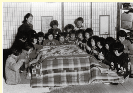
練馬から疎開した子どもの編み物練習風景(群馬県旧磯部町)