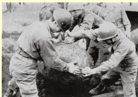
不発弾(1トン爆弾)の発掘(石神井中)