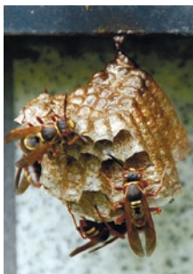
アシナガバチの巣