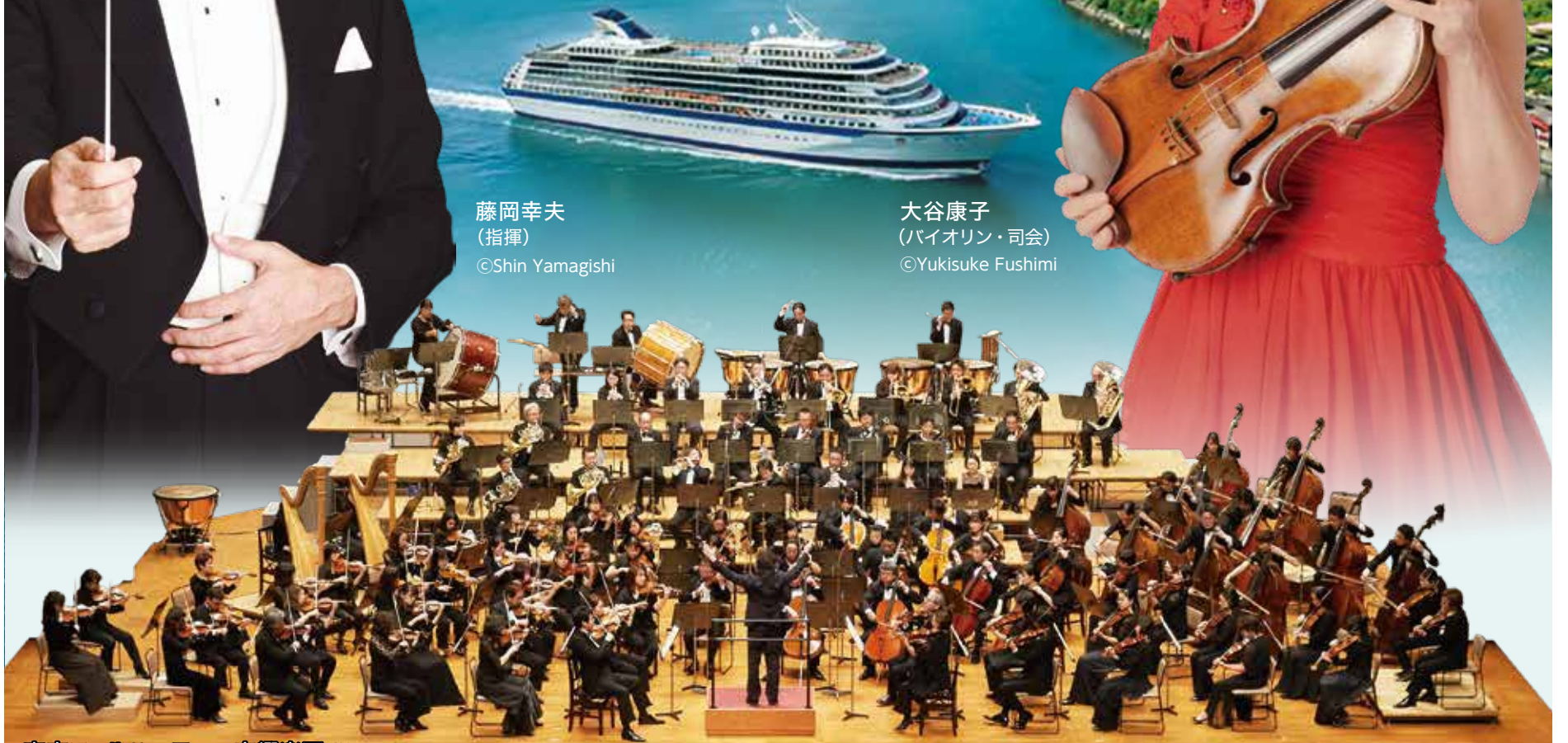
東京フィルハーモニー交響楽団 (管弦楽)