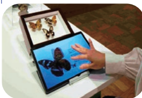
▲3Dタブレットの標本

日①8月2日(日)午後2時~3時30分 講 東京大学総合研究博物館講師/矢後勝也 定 20名(抽選)