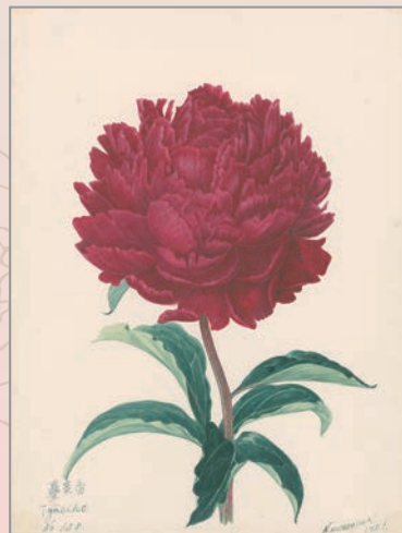
「シャクヤク(豊英香)」 大正10年 ©BAM