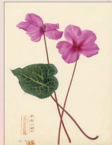
「シクラメン」 大正10年 東京都農林総合研究センター蔵