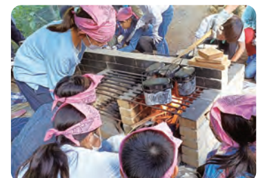
キャンプでの飯ごうの様子(埼玉県秩父市)

で配布する募集案内をご覧ください。2月6日(必着)までに青少年係 ☎5984-4691