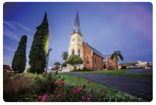
オーストラリア・イプスウィッチ市

▶日時:1月22日(月)~29日(月)午前8時45分~午後8時(22日は正午から。29日は正午まで)