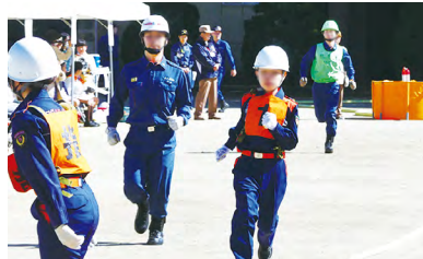
軽可搬ポンプ操法大会の様子