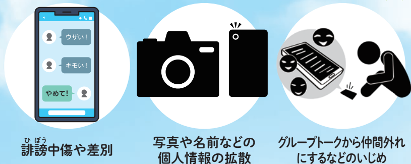
ひぼう 誹謗中傷や差別