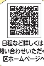
日程など詳しくは、お問い合わせいただくか、区ホームページへ

銭湯の営業開始前に筋力トレーニングなどの体操教室を行います。体操の後はゆっくり入浴を楽しめます。▶対象:医師から運動を止められていない65歳以上の方▶費用:200円(入浴料込み)▶申込:当日会場へ▶問合せ:介護予防係 ☎5984-2094