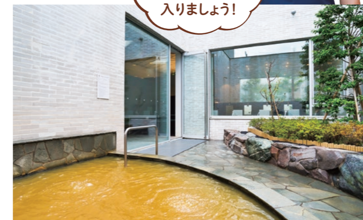
地下1,500mから引いた、さまざまな効能がある温泉 (天然温泉 久松湯④)