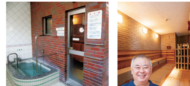
サウナ後のよく冷えた水風呂は最高! (ゆ〜ポッポ⑫)

最近はやりのサウナで「ととのって」みませんか。また、露天風呂が楽しめる銭湯もあります。お風呂に入りながら季節を感じることが出来ますよ。 ※サウナの料金は銭湯によって異なります。