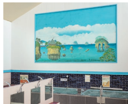
銭湯絵師が年に1回程度、描き直しています (北町浴場⑪)