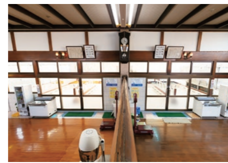
50年以上前からある、歴史ある脱衣場 (三原台 富士の湯⑨)