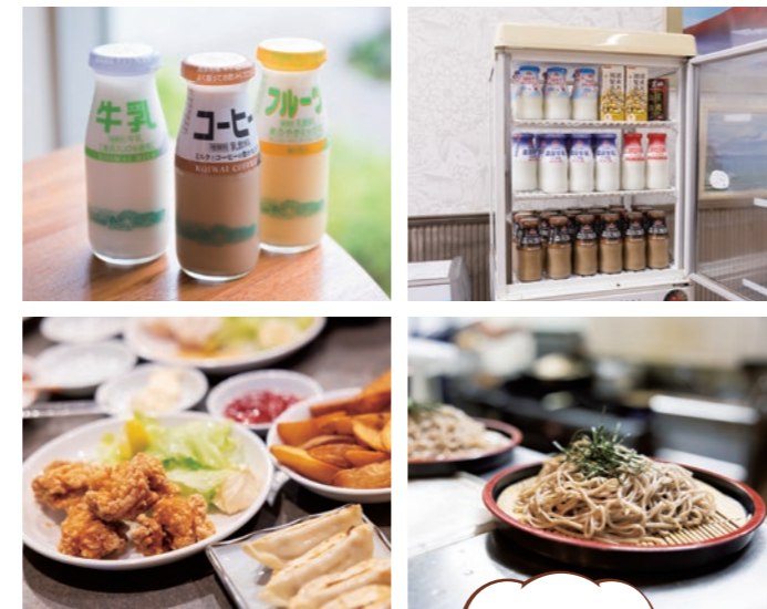
アイスもおいしいよ!

銭湯といえば瓶牛乳ですが、そばやカレーなどを食べたり、お酒を飲んだりもできます。お風呂上がりにならなくても幸せな気分になれますよ。