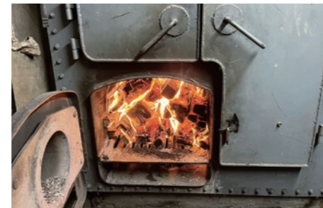
釜に薪を入れてお湯を沸かします (豊宏湯⑦)