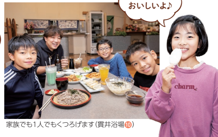
家族でも1人でもくつろげます (貫井浴場⑩)