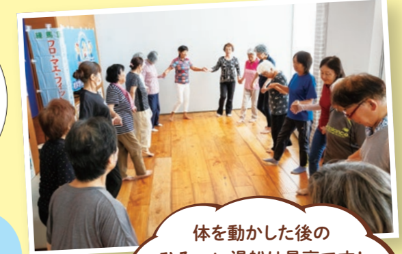
体を動かした後のひろ〜い湯船は最高です! 通常よりお得に入浴できるのも魅力ですよ。