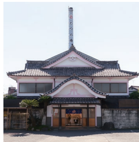
趣のある宮造りと煙突が特徴 (たつの湯⑩)

昔にタイムスリップしたかのような雰囲気、銭湯の魅力のひとつ。初めて見る方もいるのではないのでしょうか。