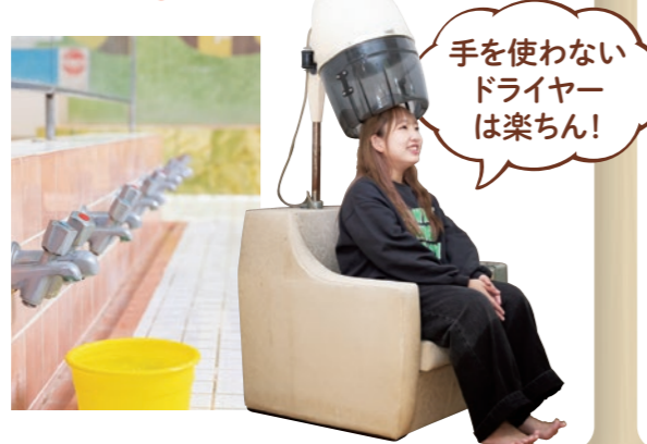
手を使わないドライヤーは楽ちん!