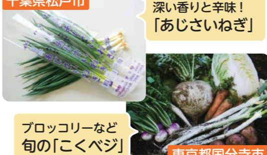
深い香りと辛味! 「あじさいねぎ」