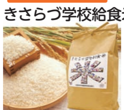
きさらづ学校給食米