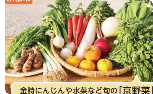
金時にんじんや水菜など旬の「京野菜」