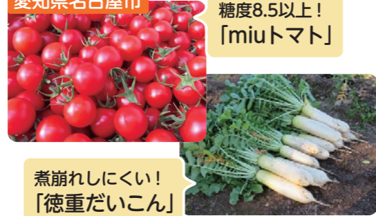
煮崩れしにくい! 「徳重だいこん」