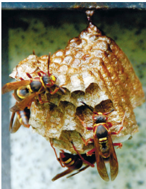
アシナガバチの巣