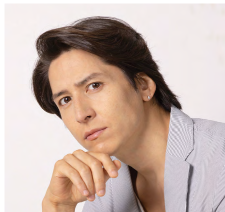
いりえ かなた 伊礼 彼方

昭和57年生まれ、神奈川県出身。平成18年ミュージカル「テニスの王子様」で舞台デビュー。ミュージカル「エリザベート」「レ・ミゼラブル」「ミス・サイゴン」などに出演。