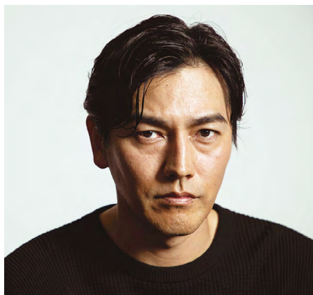
かなめ じゅん 要潤

昭和56年生まれ、香川県出身。平成13年「仮面ライダーアギト」でデビュー。ドラマ「フィクサー」「TOKYO MER〜走る緊急救命室」などに出演。