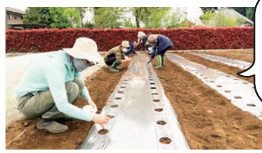
「ねりま農サポーター」の種まきの様子

都市農業を支える援農ボランティア「ねりま農サポーター」が育てたジャガイモやトウモロコシが収穫できます。 ※収穫できる野菜は、生育状況により変更になる場合があります。 ▶対象:区内在住の2名以上のグループ ※未就学児1名につき保護者1名の参加が必要です。▶日時:7月8日(土)午前9時30分~11時30分▶場所:農の学校(高松1-35-2)▶定員:100組程度(先着順)▶費用:1組700円▶申込:当日会場へ▶問合せ:農業振興係 ☎5984-1403