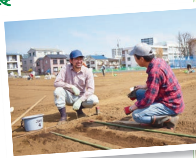
農業者ならではのコツを伝授！

私の推しは、農業者の指導を受けながら、野菜の作付けから収穫までを体験できる「農業体験農園」です。区内に18カ所あり、例年1月に募集を開始します。一から自分で育てた野菜の味は格別で、特に、採れたての枝豆とトウモロコシのおいしさには多くの利用者さんが驚いていますよ。