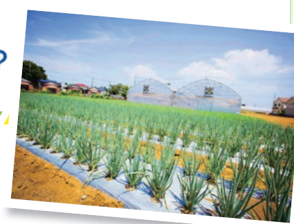
「あじさいねぎ」は通年収穫できます