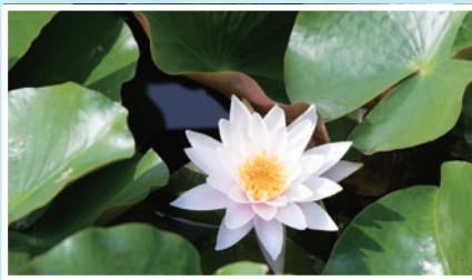
スイレン(石神井公園)