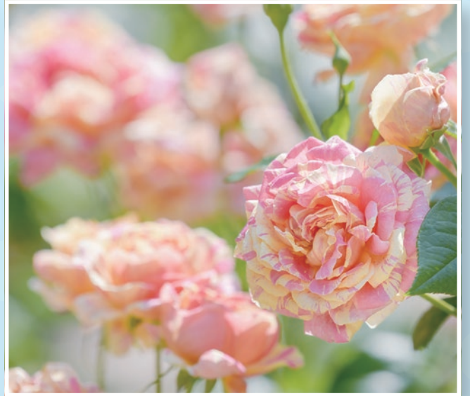
シンボルローズ「四季の香」(四季の香ローズガーデン)