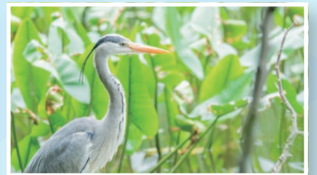
アオサギ(石神井公園)