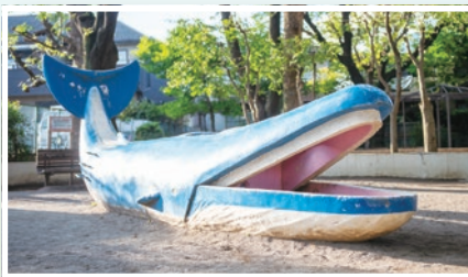
田柄中央児童公園