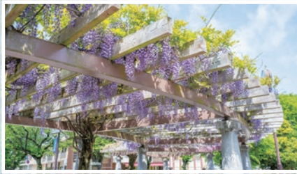
フジ(大泉中央公園)