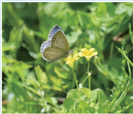
ヤマトシジミ(向山庭園)