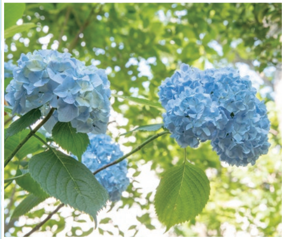
ヒメアジサイ(牧野記念庭園)