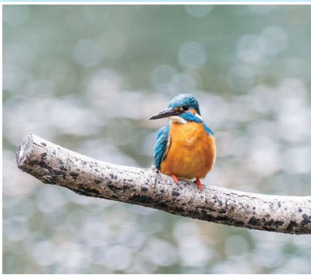
カワセミ(武蔵関公園)