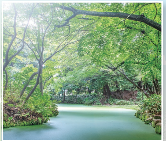
石神井公園記念庭園